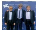
La Bcc San Marzano "approda" a Venezia

Ritaglio stampa ad uso esclusivo del destinatario, non riproducibile.