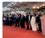
La Bcc San Marzano "approda" a Venezia